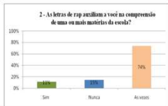
Gráfico 2: Letras de rap em relação a escola.

Por meio da questão apresentada no gráfico 1, percebe-se que as letras influenciam diretamente no pensamento da grande maioria dos ouvintes, estimulando a reflexão de um tema ou de assuntos relacionados à sua própria vida e decisões a serem tomadas. Com relação ao gráfico 2 é possível afirmar que, conforme a opinião dos entrevistados, ainda que seja pouco, as letras de rap ajudam na vida didática dos ouvintes. No entanto, o gráfico mostra que a maioria dos ouvintes são auxiliados pelo Rap em algum matéria escolar, demonstrando um potencial que pode explorado pelo meio acadêmico junto aos alunos.