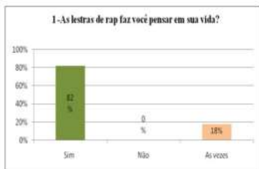
Gráfico 1: Letras de rap em relação a vida.

Os resultados são graficamente apresentados a seguir.