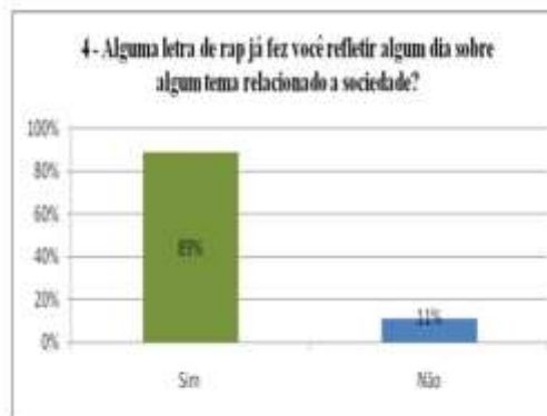
Gráfico 2: Letras de rap em relação a sociedade.

Os resultados do gráfico 3 demonstram que mesmo que as letras de rap tenham influência na vida das pessoas, conforme a opinião do público entrevistado, elas não induzem a formar opinião sobre o voto. Ainda que as letras apresentem informações que abordam assuntos relacionados à sociedade, pela ótica dos entrevistados o rap não influencia no momento do voto.